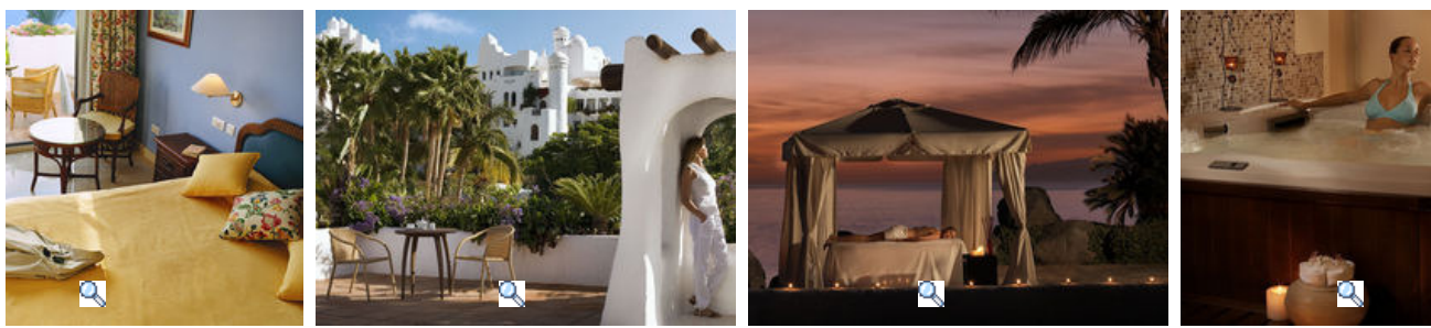
Mallorca Kanarische Inseln Andalusien Portugal Italien Europa Weltweit English