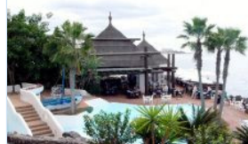
Bilder Hotel Jardin Tropical